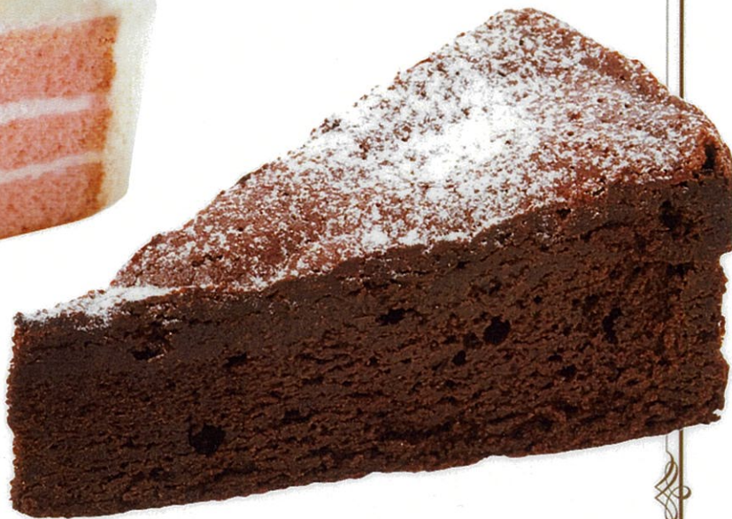
ずっしり濃厚 ガトーショコラ