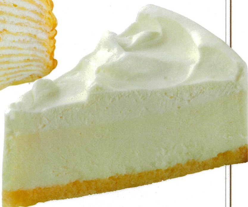
国産素材のレアチーズケーキ