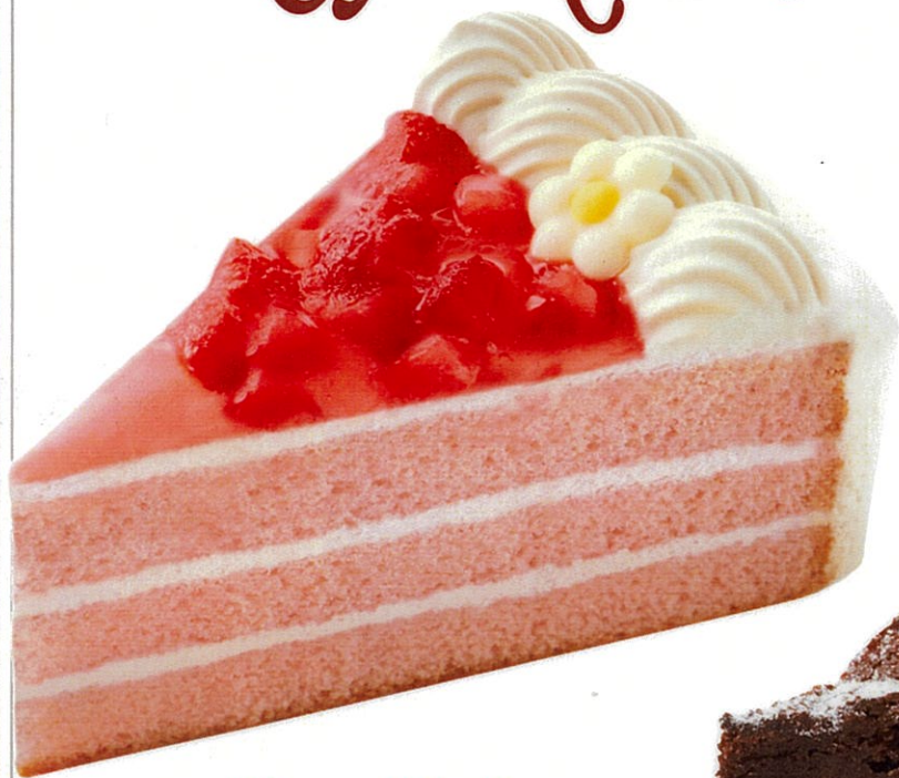
アールグレイ仕立ての 苺ミルクティーケーキ